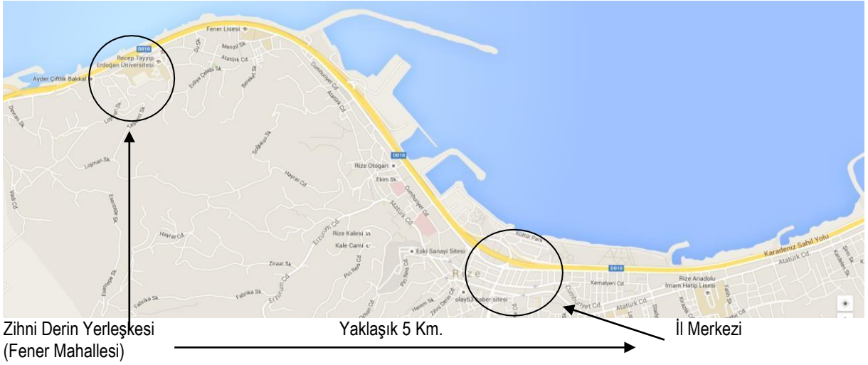
Harita 1: RTEÜ Zihni Derin Yerleşkesi

ADRES: Recep Tayyip Erdoğan Üniversitesi, Beden Eğitimi ve Spor Yüksekokulu, Zihni Derin Yerleşkesi, 53100, Fener Mahallesi, Merkez/RİZE